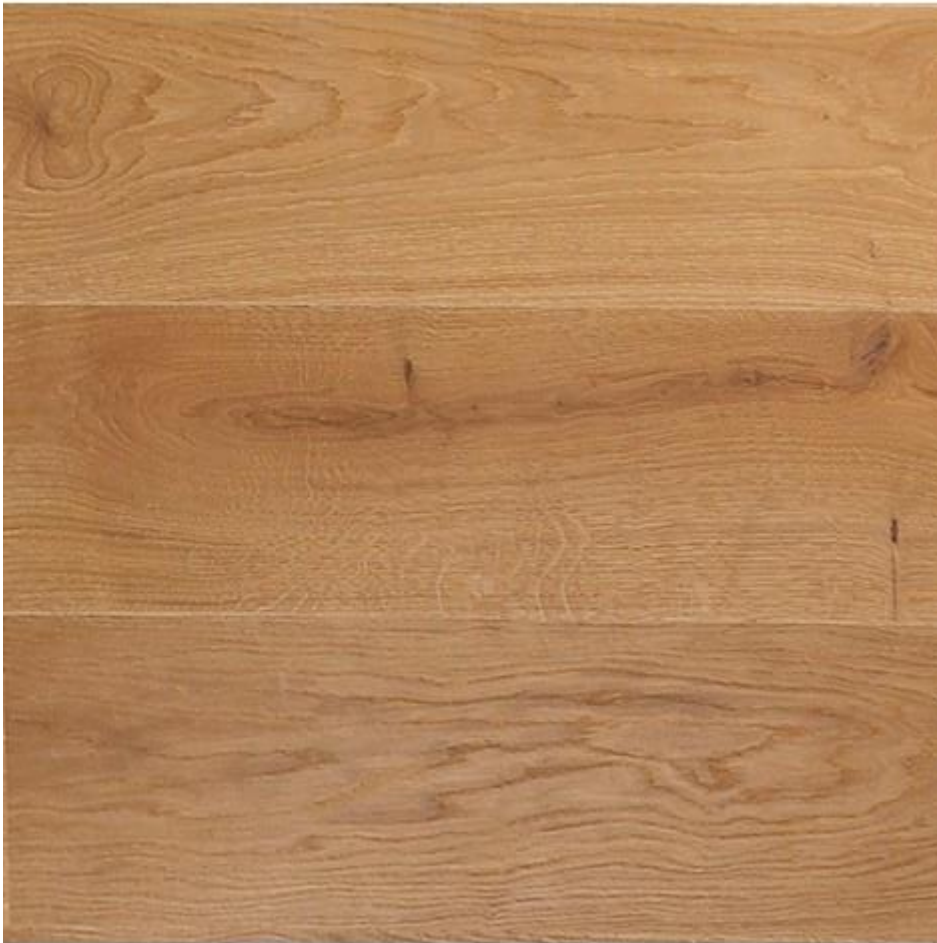
EICHEN-Landhausdielen – geölt

Die Produkte im Ausstattungskatalog sind Musterbeispiele. Farbabweichungen können vorkommen. Die Fliesen und der Holzboden können vor Ort besichtigt werden.